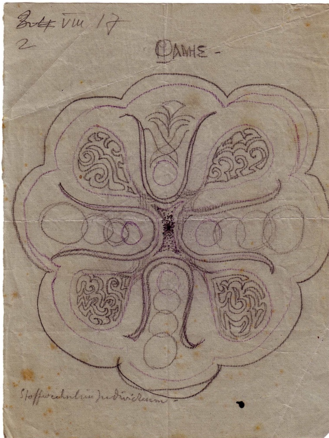
Mandalaskizze 1, 2. August 1917, Bleistift und Buntstift auf Papier, 19,2 x 14,5 cm

Die psychologische Bedeutung des Mandalas begann sich Jung 1916 anhand von 29 Skizzen zu erschliessen, die er innerhalb von sieben Wochen zeichnete. Die aktuelle Sonderausstellung zeigt davon eine Auswahl. Die Titel der ersten Zeichnung, die im Original zu sehen ist, lauten «Phanes» und «Stoffwechsel im Individuum». Sie weisen darauf hin, dass es um die Herausbildung eines neuen